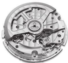
Jaeger-LeCoultre 积家 759 型机芯